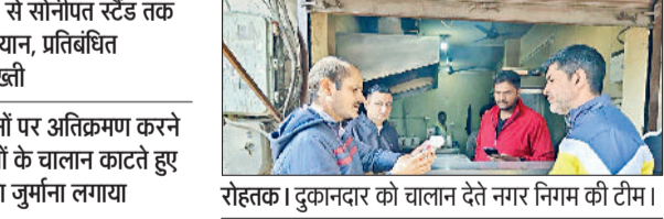
रोहतक। दुकानदार को चालान देते नगर निगम की टीम।