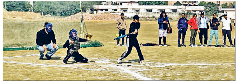
रोहतक। एमडीयू में सॉफ्टबॉल प्रतियोगिता में खेलती खिलाड़ी।