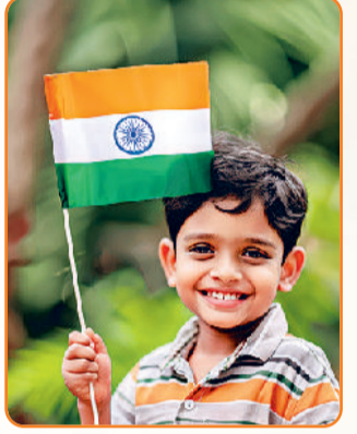
भारत माता का यश गाएं। ध्वज निर्भय फहराएं हम। गाओ वंदे मातरम्।

गाओ वंदे मातरम् गाओ वंदे मातरम्। राष्ट्रगीत के बोल निराले। मन में अज गजाने वाले। मनभावन लय स्वर सरगम। गाओ वंदे मातरम्। जननी जन्मभूमि की जय हो। जग में यश अनंत अक्षय हो। सुखदाईं शुभ सुंदरम्। गाओ वंदे मातरम्। आओ मिलकर कदम बढ़ाएं। भारत माता का यश गाएं। ध्वज निर्भय फहराएं हम। गाओ वंदे मातरम्।