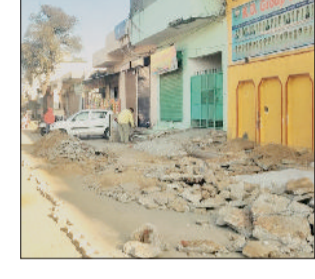
लाडौत रोड पर भी विभागीय तालमेल की कमी का मामला सामने आया। यहां 92 लाख रुपये की लागत से सड़क पर टाइल बिछाने का कार्य शुरू किया गया। स्थानीय लोगों ने इसका विरोध करते हुए कहा कि यहां पहले से सीमेंट की सड़क मौजूद है इस पर पाइडब्ल्यूडी के एसडीओ ने बताया कि केडी स्कूल के आसपास बरसात के समय पानी भर जाता है। पब्लिक हेल्थ विभाग द्वारा सीवर नहीं डाले जाने के कारण सड़क काट दी गई थी। लेवल सही करने के लिए टाइल बिछाई जा रही थी।